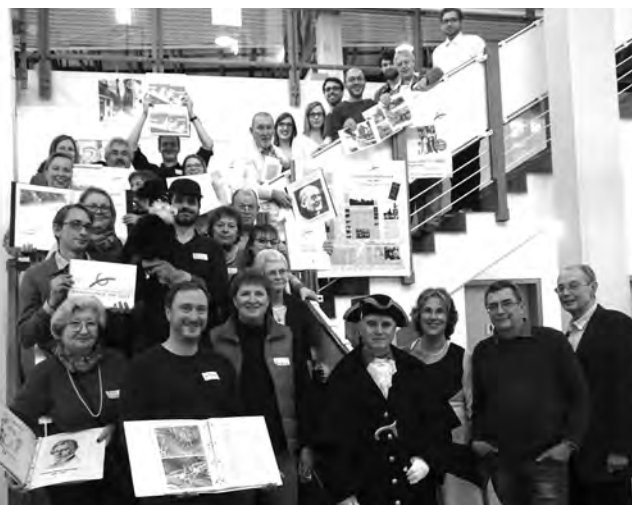
Das Team von „Geographie für Alle“ wartet auf Sie!

Ausführliche Inhaltsangaben zu allen Führungen unter www.geographie-fuer-alle.de